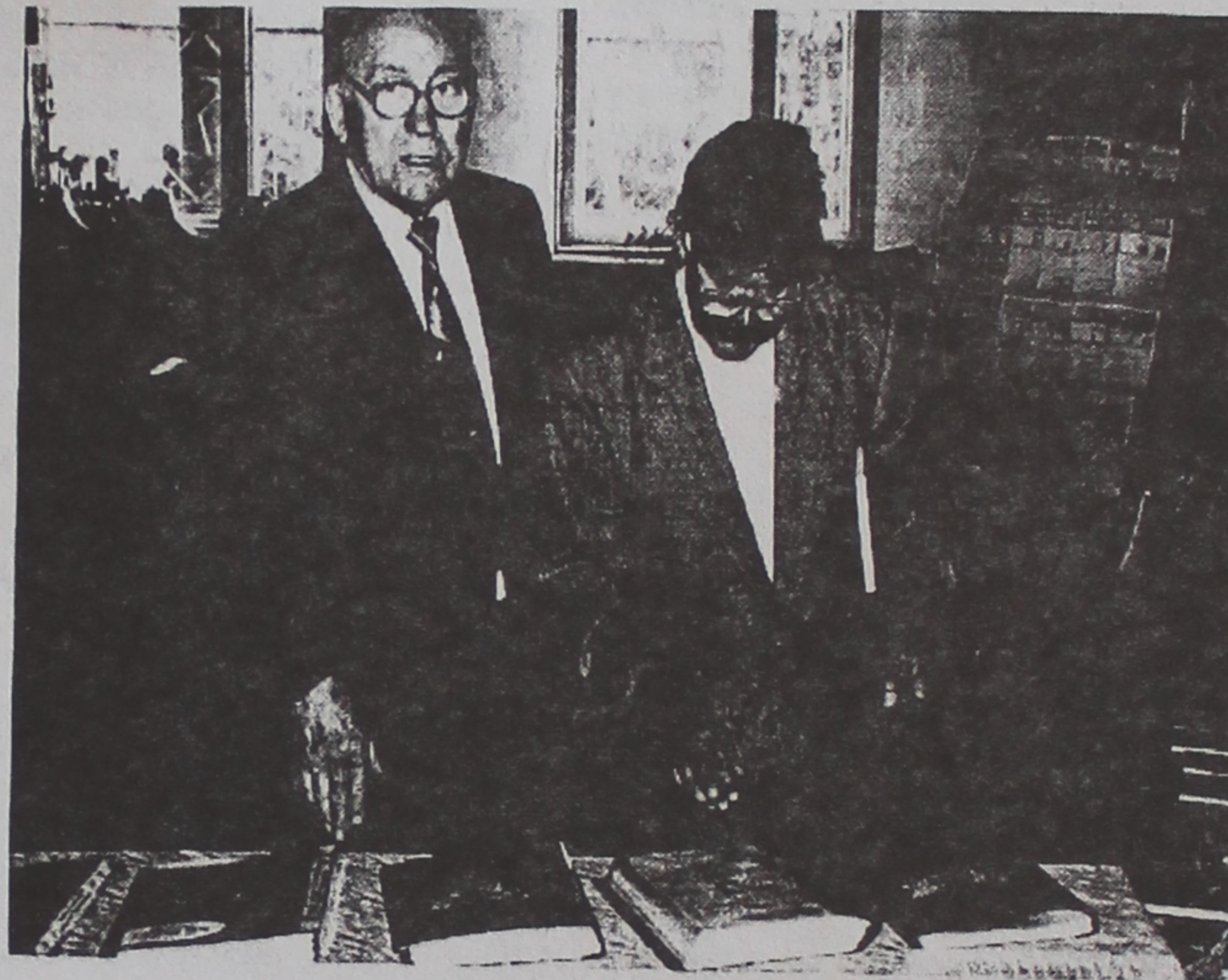
Сёлета ў нашым універсітэце шырока і ўрачыста адзначаны 80-гадовы юбілей аднаго з самых вядомых у краіне вучоных у галіне педагогікі доктара педагогічных навук, прафесара, акадэміка Нацыянальнай акадэміі навук Беларусі, загадчыка кафедры педагогікі І.Ф.Харламава. У выкладчыкаў, супрацоўнікаў, студэнтаў і шматлікіх гасцей вялікую цікавасць выклікала выстаўка яго навуковых прац. На здымку: І.Ф.Харламаў (злева) і ганаровы прафесар універсітэта, член-карэспандэнт НАН Беларусі Л.А.Шамяткоў, які знаёміцца з выстаўкай навуковых прац юбіляра.

чынным арганізацыйным і каардынацыйным удзеле М.М.Заразакі і фінансавай падтрымцы Рэчыцкага гарвыканкама. Акрамя гэтага, выкананне пратакола дазволіла ГДУ наладзіць сур'ёзныя навуковыя сувязі і супрацоўніцтва з даследчыцкімі ўстановамі і навукоўцамі як у межах Беларусі, так і міжнародныя. Гэта датычыць не толькі Доўнараўскіх чытанняў, у якіх ужо прынялі ўдзел больш 40 даследчыкаў з Гомеля, Мінска, Гродна, Мазыра, Кіева, Масквы, Бранска. Мы лічым поспехам заключэнне дагавора аб навуковым супрацоўніцтве паміж ГДУ імя Ф.Скарыны, Бранскім дзяржаўным універсітэтам імя Пятроўскага і Украінскім навукова-даследчым інстытутам справаводства і архіўнай справы, у межах якога распачата двухгадовая праграма даследавання творчай спадчыны М.В.Доўнар-Запольскага ў кантэксце гісторыі і культуры ўсходнеславянскіх народаў. Да ўдзелу ў выкананні гэтай праграмы прыцягнуты, акрамя навуковых сіл ГДУ і нашых партнёраў на Украіне і ў Расіі, таксама даследчыкі з Белдзяржуніверсітэта, Нацыянальнага архіва і Нацыянальнай бібліятэкі Рэспублікі Беларусь, Нацыянальнага навукова-асветніцкага Цэнтра імя Ф.Скарыны, Беларускага навукова-даследчага інстытута архіўнай справы і справаводства.