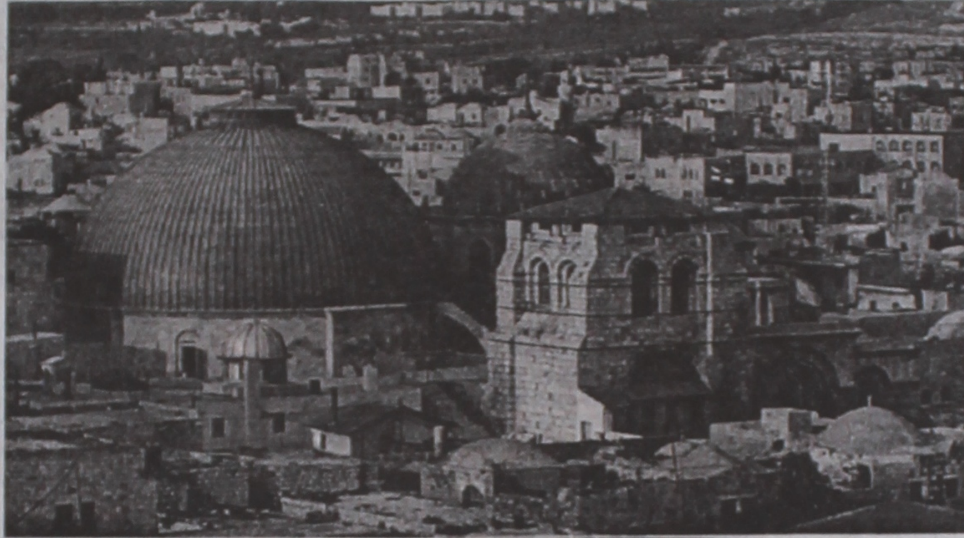
Іерусалім з вышыні птушынага палёту.

Любы чалавек, стоячы ля сцяны, можа не толькі пагаварыць з Усявышнім, але і папрасіць аб нечым важным, істотным у яго жыцці, выказаць запаветнае жаданне, якое з часам абавязкова павінна спраўдзіцца. А рытуал гэты адбываецца наступным чынам.