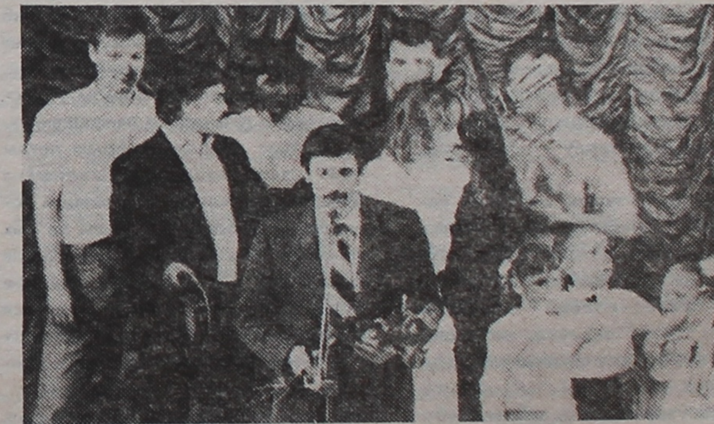
На здымку: фінальны момант гала-канцэрта.

Праграму вялі былыя вядучыя канцэртных і конкурсных праграм клуба "Малодосць" Святлана Страіцэлева і Андрэй Віннікаў, а таксама мастацкі кіраўнік (яна ж ініцыятар правядзення гэтага гала-канцэрта) Марына Шырынкіна. Трэба аддаць належнае яе арганізатарскім здольнасцям, бо ўсё атрымалася на вышэйшым узроўні.