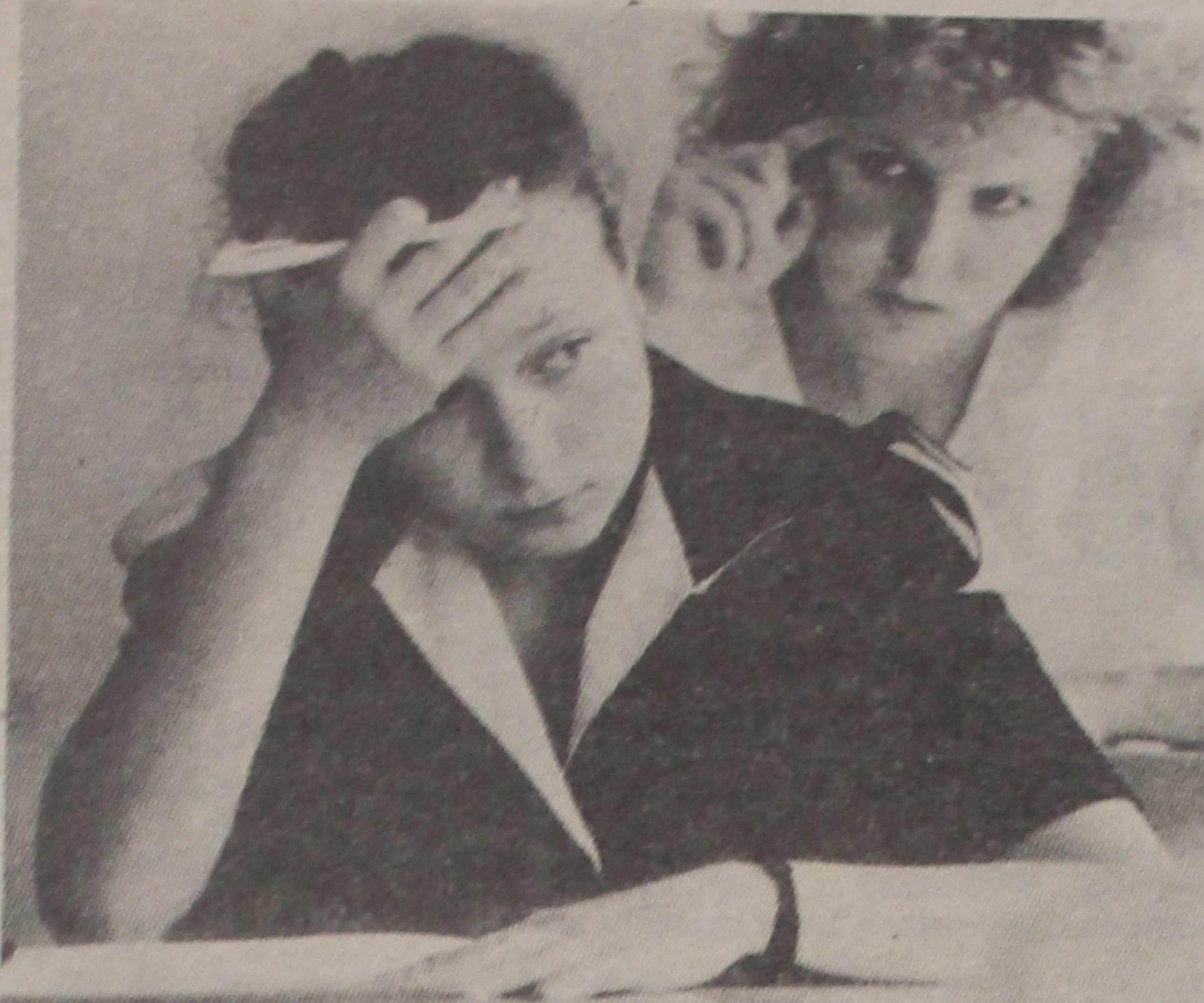
Быць ці не быць?

Праходны бал ва ўніверсітэце сёлета ў цэлым склаўся даволі высокім. Максімальным — 10 — ён аказаўся на спецыяльнасцях «Руская мова і літаратура», «Фізічная культура», «Правазнаўства». 9 набраных балаў гарантавалі паступленне на педагагічны патак матэматычнага факультэта, спецыяльнасці: «Геаграфія», «Вухагалтарскі ўлік, кантроль і аналіз гаспадарчай дзейнасці», «Эканоміка і сацыялогія працы», 8 — на спецыяльнасці: «Беларуская мова і літаратура», «Праграмнае забеспячэнне