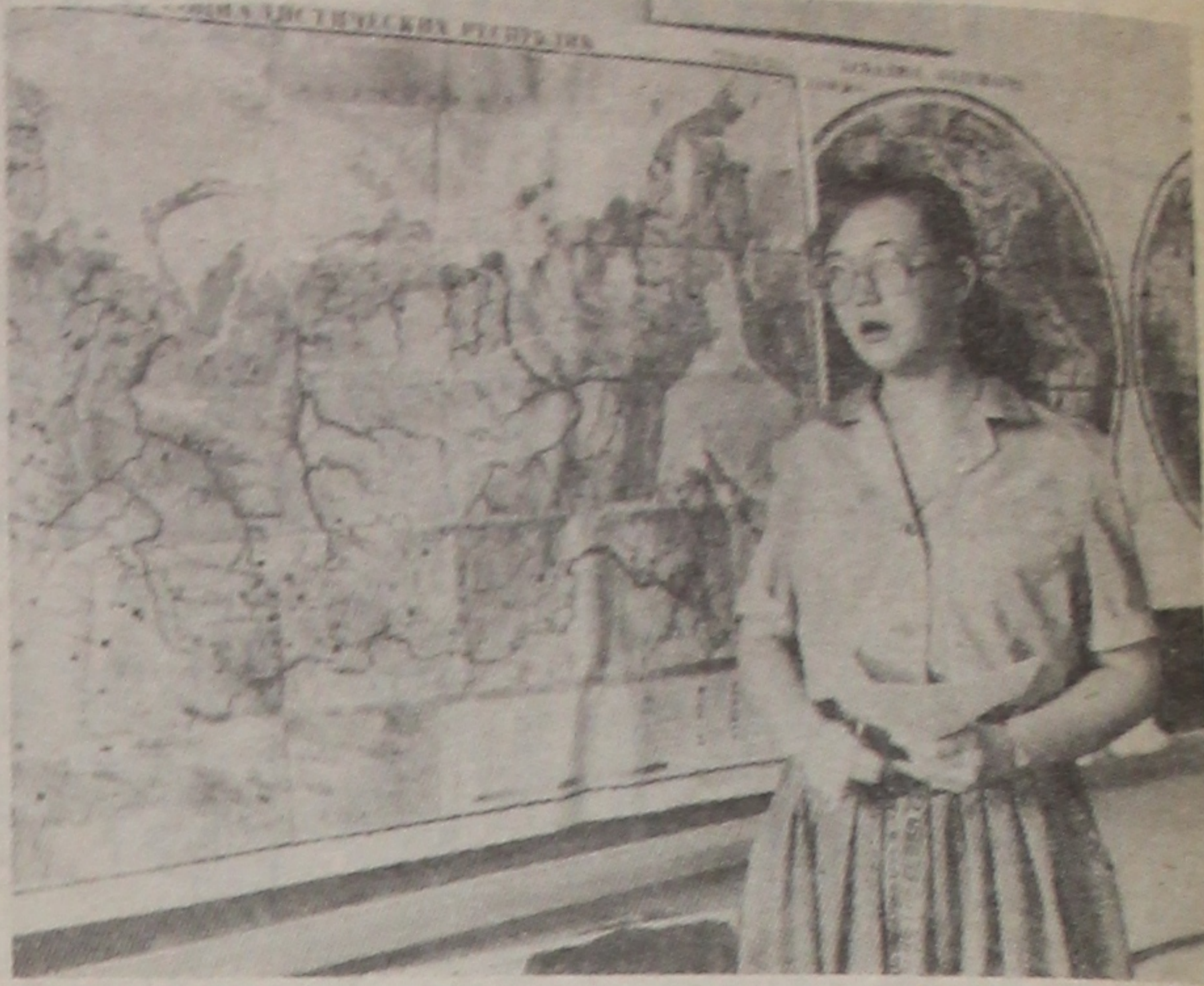
Экзамен па геаграфіі таксама не з лёгкіх.

Дарэчы, з паўпраходным балам у ГДУ залічаны 132