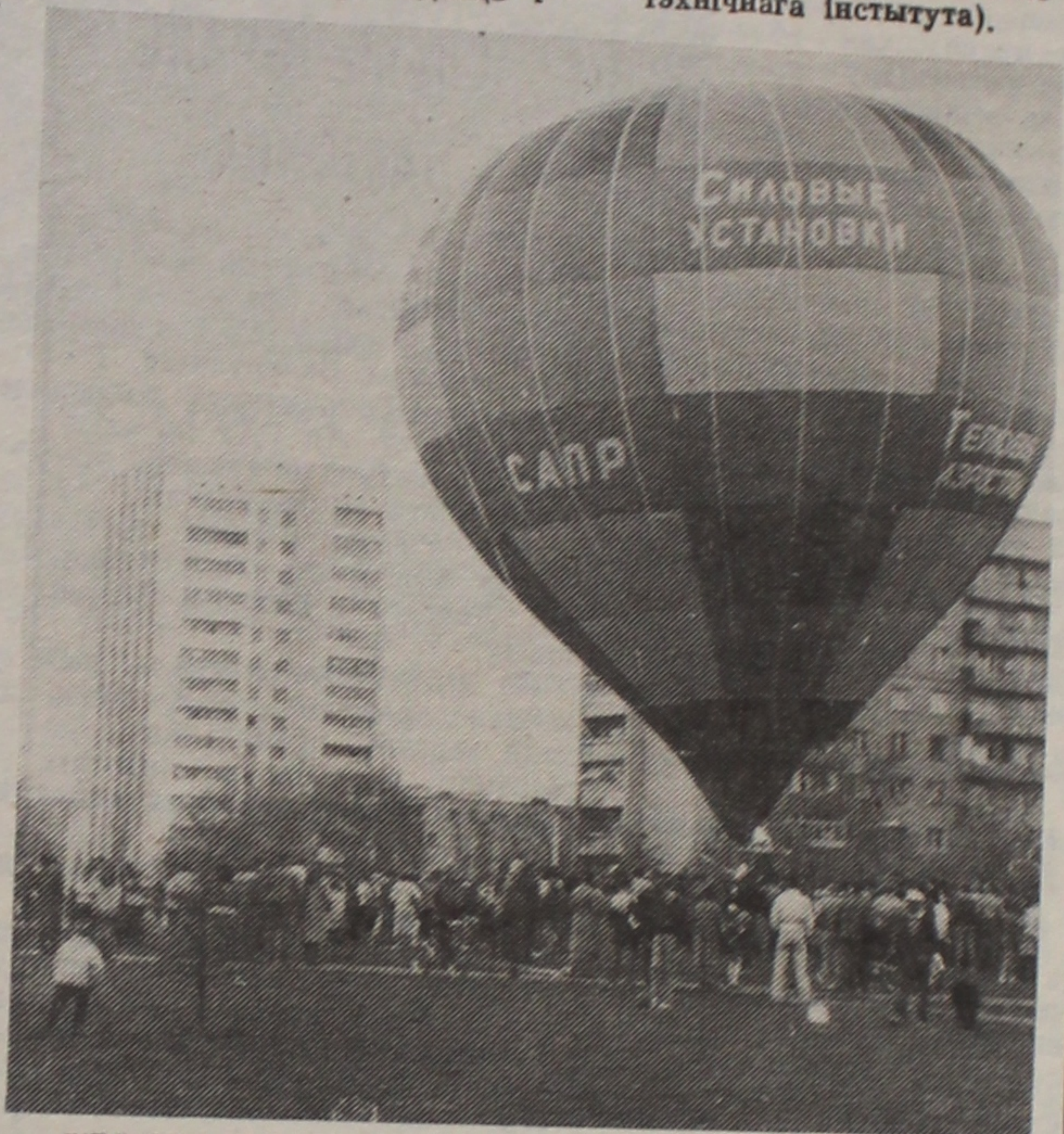
УВЫШЫНІЮ ЗА ВЕДАМІ...

(З газеты «Советский ин-женер» Беларускага полі-тэхнічнага інстытута).