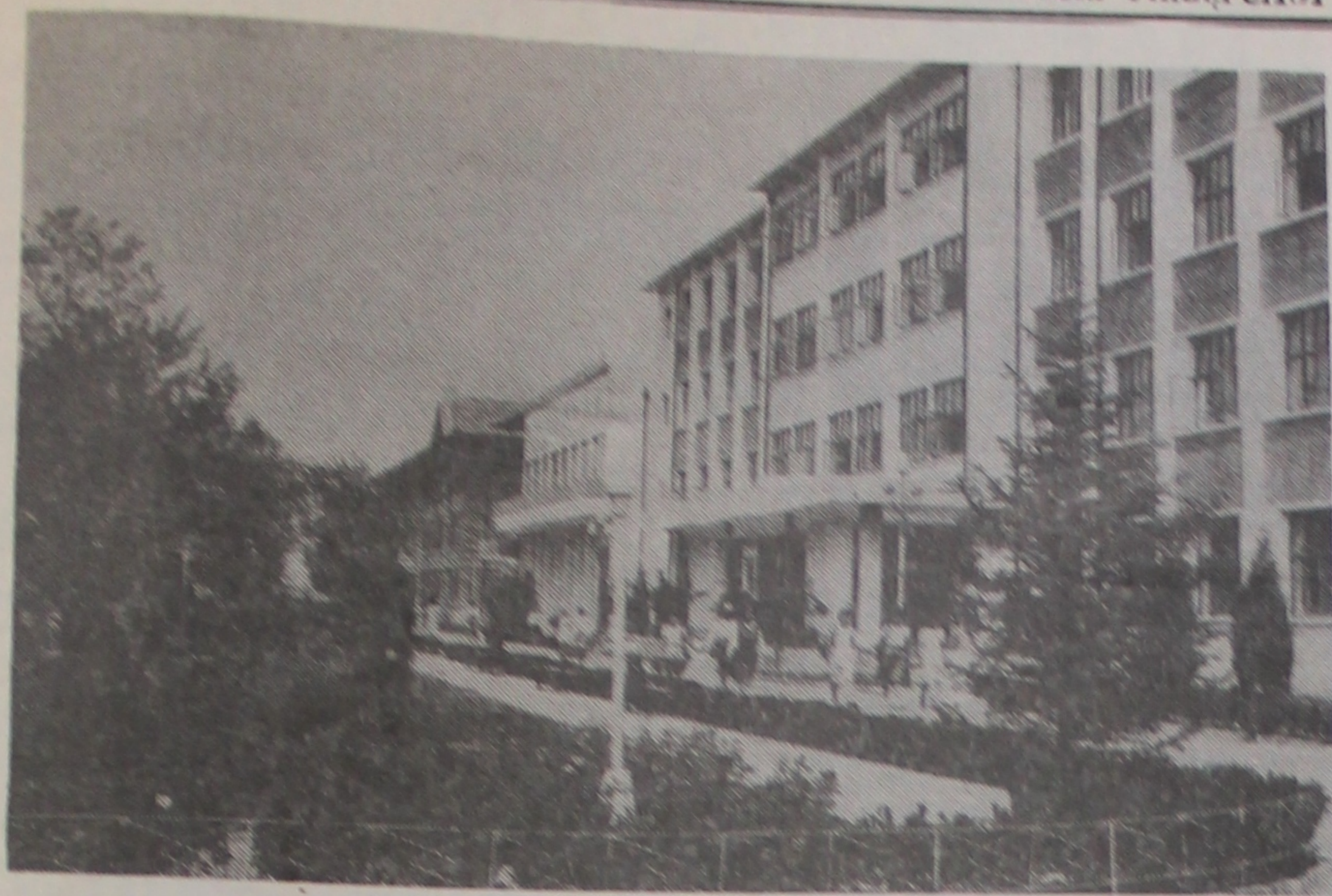
ЦЯНЬЦЗІНСКІ ПЕДАГАГІЧНЫ УНІВЕРСИТЭТ.