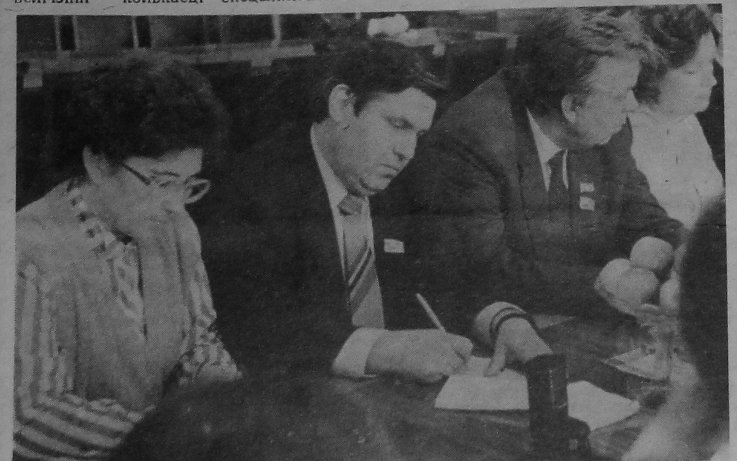
НА ЗДЫМКУ: у час работы XVIII з'езда прафсаюзаў СССР. Крайняя