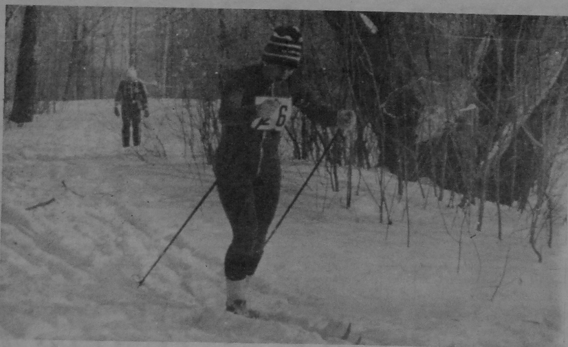
НА ЗДЫМКУ: на дыстанцыі — дзяўчаты.

Л. МАРАЗАВА, галоўны суддзя спарторніцтваў.