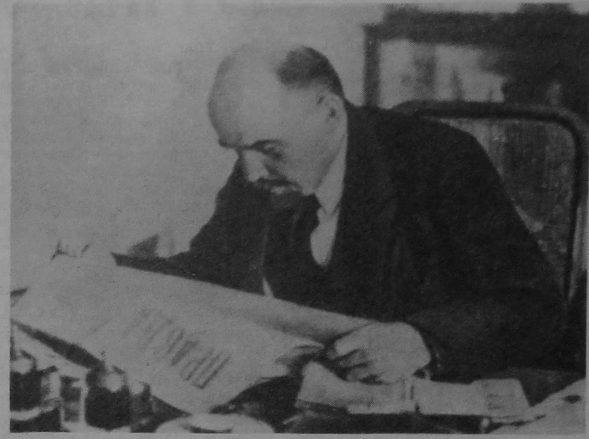
У. П. Ленін чытае газету «Правда».

аказваць садзейнічанне ў паспяховым вырашэнні ўсіх задач, якія ставяць цяпер перад вышэйшай школай. Яе карэнная перабудова, якаснае павышэнне падрыхтоўкі спецыялістаў заўрашняга дня, іх камуністычнае выхаванне — асноўныя тэмы публікацый. Калектыў рэдакцыі нашай газеты — невялікі. Таму стаўка робіцца на аўтарскі актыў. Усё больш шырокае далучэнне выкладчыкаў, супрацоўнікаў, будучых маладых спецыялістаў да ўдзелу ў выпуску сваёй газеты дапаможа зрабіць яе больш цікавай, баявой. Адначасова хочацца, каб на кожнае крытычнае выступленне мы своечасова атрымлівалі канкрэтнае рэагаванне. Рэдакцыя ўпэўнена, што актыў нашай газеты з кожным днём будзе расці. Мы ахвотна