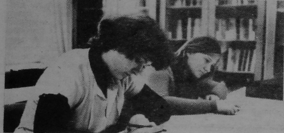
Падрыхтоўка да залку.

А. ГАЕУ, загадчык студэнцкага канструктарскага бюро.