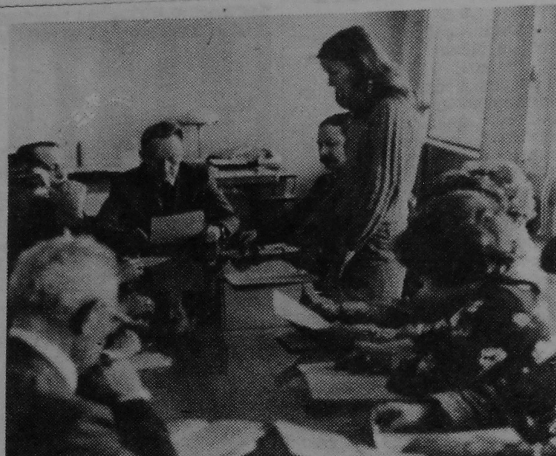
НА ЗДЫМКУ: на пасяджэнні цэнтральнага Савета па НДРС.

САВЕЦКІЯ ВУЧОНЫЯ! ПАВЫШАЙЦЕ ЭФЕКТЫВНАСЦЬ ДАСЛЕДАВАННЯЎ! НЯХАЙ МАЦНЕЕ САЮЗ НАВУКІ І ВЫТВОРЧАСЦІ! СЛАВА САВЕЦКАЙ НАВУЦЫ! (З Заклікаў ЦК КПСС да 1 Мая 1982 года).