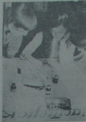
Там і байцы гараць адным жаданнем — з любога становішча выйсці пераможцамі. І мы пераадоўляем іх сумесна.

І зноў былі свае цяжкасці, свае непаладкі. Але цяжкасці маюць тую асаблівасць, што яны збліжаюць людзей. Асабліва, калі гэтыя цяжкасці даводзіцца пераадоўляць сумесна.