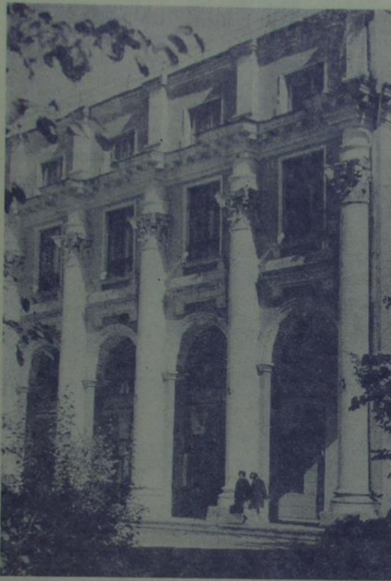
НА ЗДЫМКУ: (злева) стары і новы карпусы універсітэта. Іх аўдыторыі чакаюць першакурснікаў.