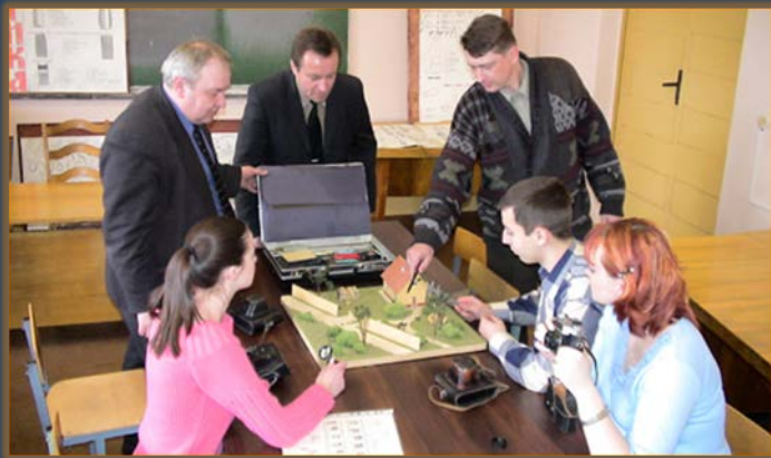
Занятие в кабинете криминалистики

Кабинеты нормативно-правовой информации, методологии государства и права и криминалистики, учебный зал судебных заседаний способствуют лучшему развитию профессиональных качеств будущих адвокатов, следователей, прокуроров и судей.