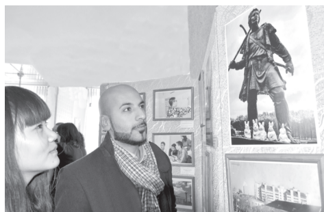
Конкурс-выставка творческих работ "Беларусь глазами иностранных студ-

ентов" прошел в стенах ГГУ. Двадцать пять авторов представили на суд жюри свои лучшие фотографии.