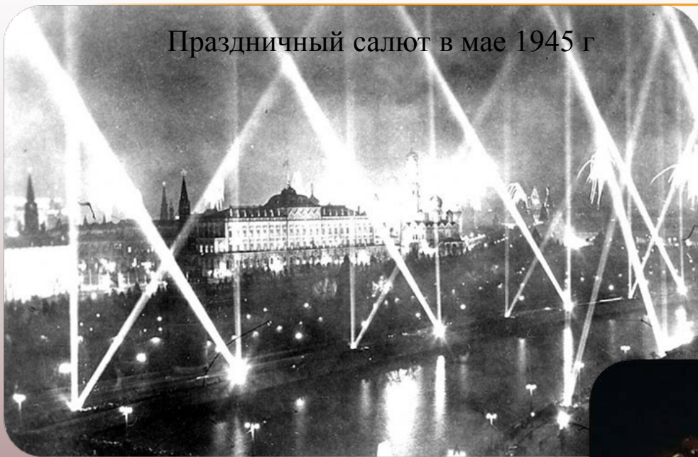
Праздничный салют в мае 1945 г