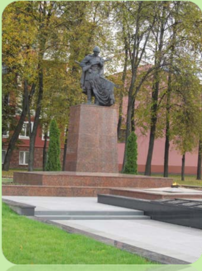
Вечный огонь на Площади труда

Вечный огонь на площади Труда, памятники и обелиски на улицах, в парках, скверах будут всегда напоминать о ратном подвиге воинов-освободителей