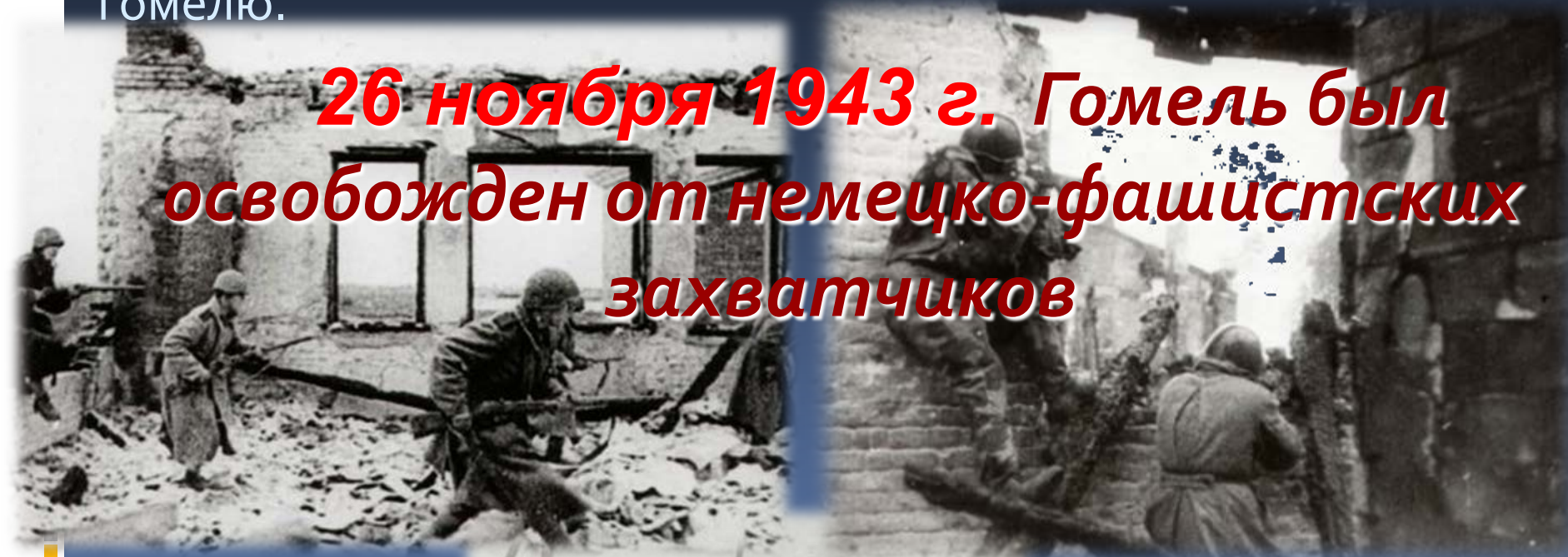
Уличный бой в г. Гомеле. 26 ноября 1943 г.

26 ноября 1943 г. Гомель был освобожден от немецко-фашистских захватчиков