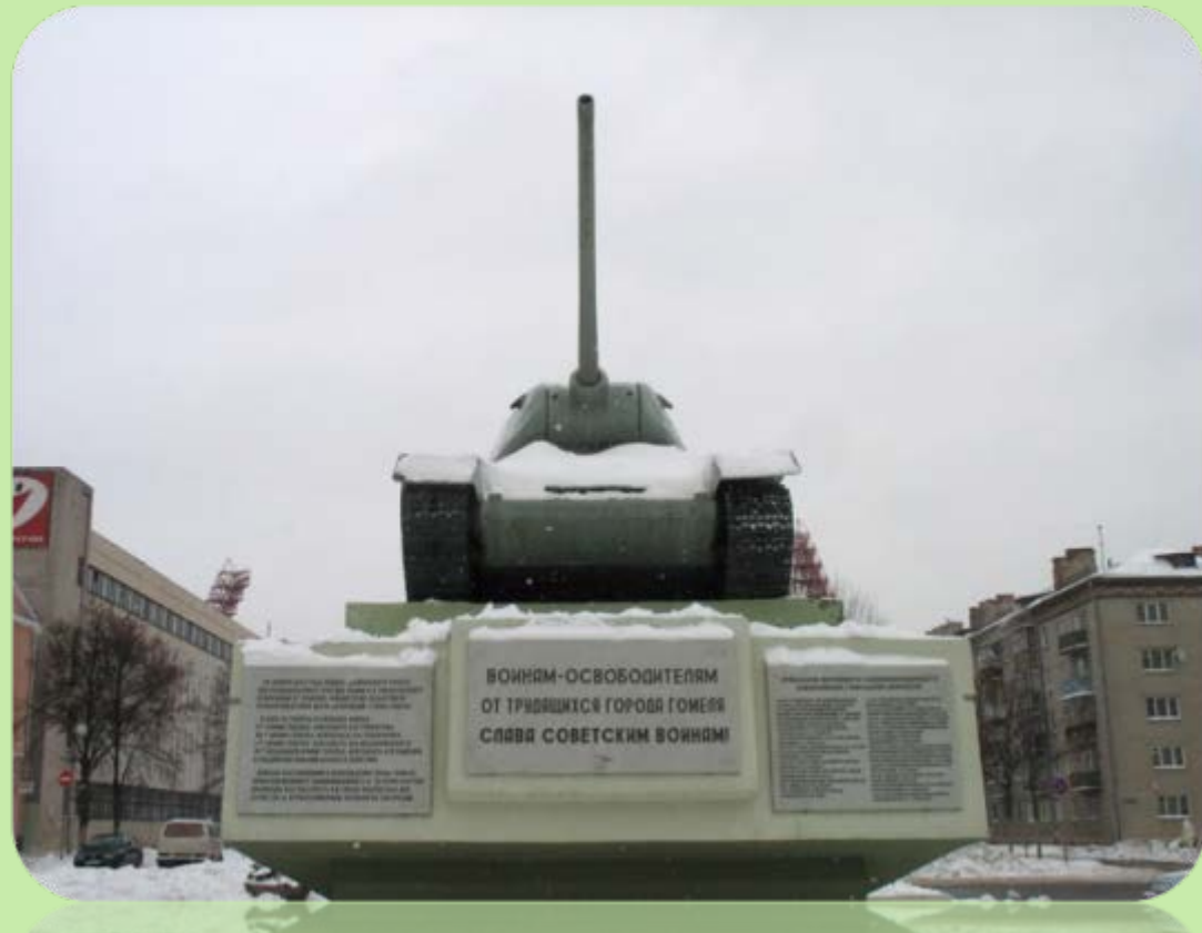
Танк Т 34-85, освобождавший город водружен на постамент