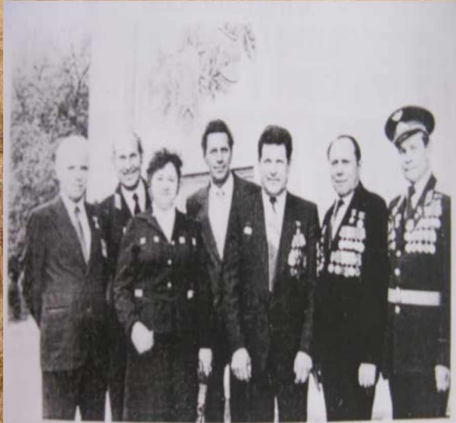
Встреча с участниками партизанского соединения А.Ф.Федорова. Киев.

За годы войны более 13 миллионов человек награждены медалями и орденами. Свыше 11 700 воинов – Герои Советского Союза.