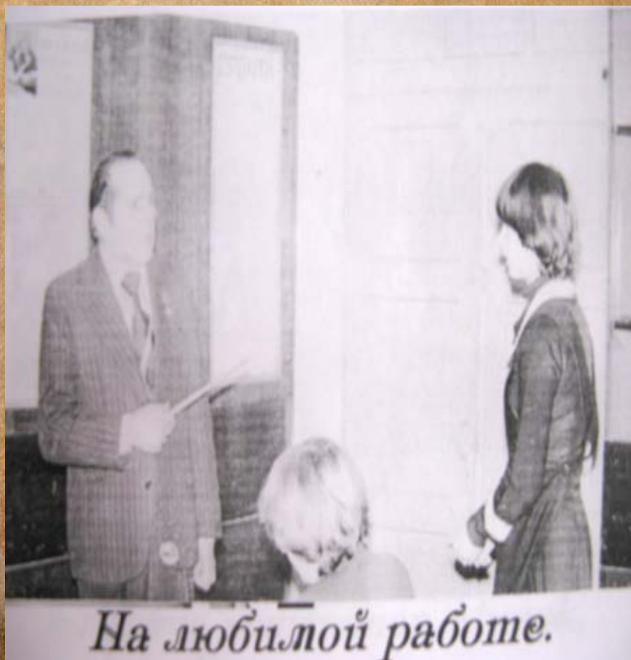
На любимой работе.